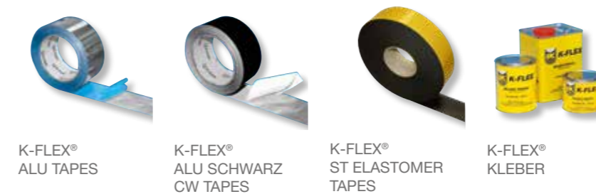
K-FLEX® ALU TAPES