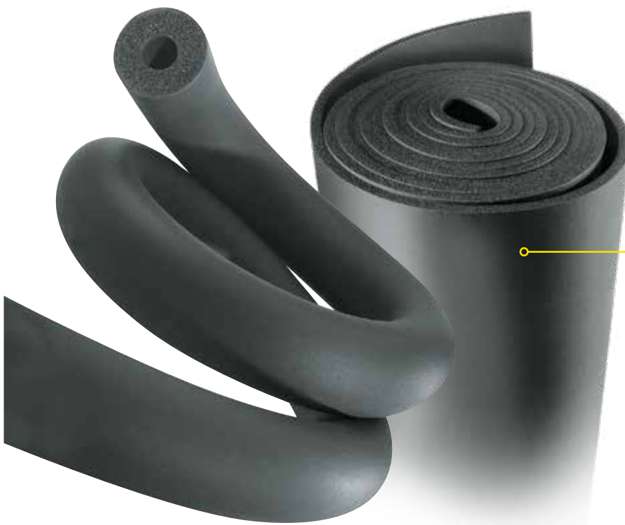
Elastomer-Isolierung für hohe Temperaturen

Die rationelle und kostengünstige Lösung für Solaranlagen und industrielle Prozesse bis zu 150°C. Auch als Endlosschlauch in ressourcenschonender Verpackung erhältlich. Eine praktische und wirtschaftliche Lösung für den Vertrieb und den Verarbeiter auf der Baustelle.